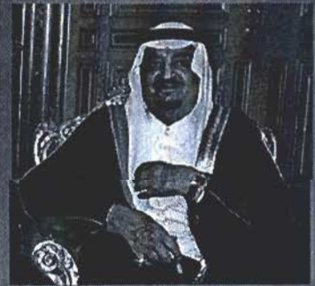
Fahd bin Abdul Aziz