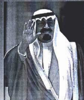
Abdullah bin Abdul-Aziz