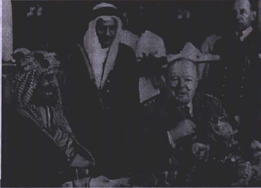
King Abdul Aziz (Ibn Saud) attending official dinner with Sir Winston Churchill, Lake Qaroun, Egypt, 17 Feb 1945.

இந்த சமயத்தில் தான் துருக்கியில் ஒரு :பிரீமேஸனான முஸ்த:பா கமால் அதிகாரத்திற்கு வந்தார். அவர் 1922 நவம்பரில் முதலில் சுல்தானிய ஆட்சியை நீக்கினார். அதன் பின், 1924 மார்ச் 3-ந் திகதி கிலா:பத்தையும் அகற்றுவதாக அறிவித்தார். இதன் காரணமாக, முஸ்லிம்களின் பெயரளவிலான கடைசி கலீ:பாவான இரண்டாம் அப்துல் மஜீத் நாடு கடத்தப்படும் கட்டாயத்திற்குள்ளானார். ஏறத்தாழ 1,300ஆண்டுகளுக்கு முன்னர், மதீனாவில்