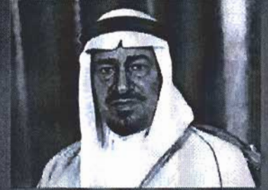
Khalid bin Abdul-Aziz