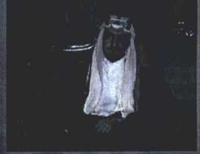
Faisal bin Abdul-Aziz