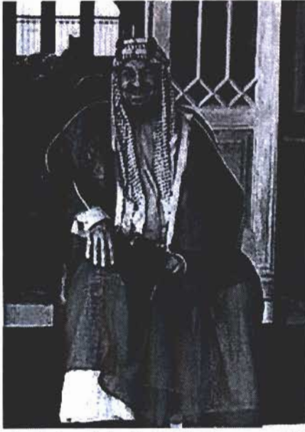
Abdul-Aziz bin Abdul Rahman bin Faisal bin Turki bin Abdullah bin Muhammad bin Saud

சவுத் பரம்பரையின் ஜாஹிலியத்தான அடிவோர்களும் அழிச்சாட்டிய வகிபாகமும்