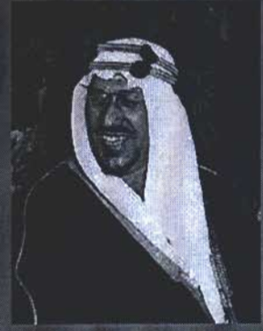
Saud bin Abdul-Aziz